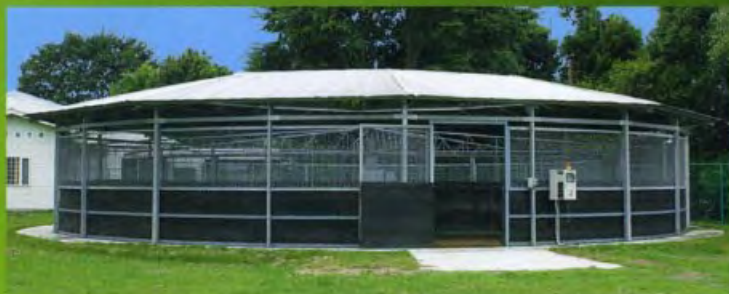
競走馬用ウォーキングマシン

天然芝が敷き詰められ手入れの行き届いた検査場敷地内には整備された41頭の馬房をはじめ、競走馬用ウォーキングマシンなどの充実した設備が整っております。